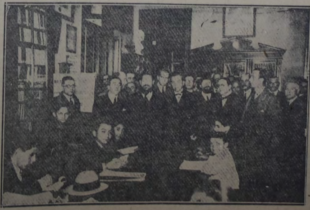
VISITA DE ALBERT THOMAS

Existen también los "socios colectivos", que los constituyen las sociedades que se incorporan a la institución. Los componentes de ellas, mediante una cuota especial que paga el afiliado, gozan de todos los derechos que tienen los socios ordinarios. Esta cuota ofrecida por la Biblioteca ha dado buenos resultados. Ya que ha permitido la entrega de libros a individuos de escasos recursos, que por su condición económica, no hubieran podido gozarse. Entre los socios colectivos figuran: "Unión Obrera Municipal", "Obreros en el campo", "Industria del cuero", "Centro Socialista de la sección 1.ª", "Ateneo Popular", etc. La Comisión desea extender su acción