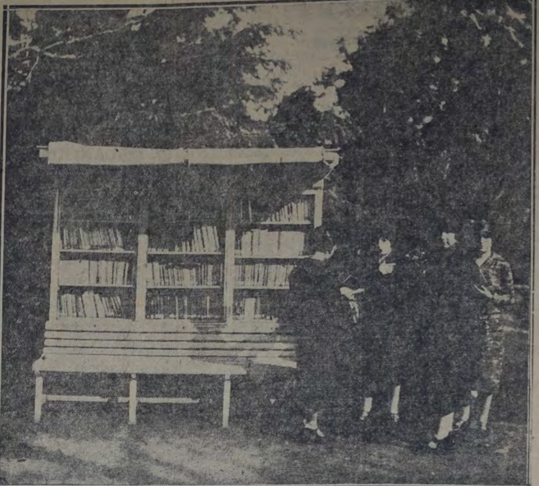
LA BIBLIOTECA PUBLICA EN EL JARDIN BOTANICO