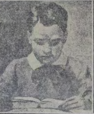
AÑO 1925 -- 15.500 LECTORES

El principio a que aludimos es el siguiente: "Ninguna administración que otorgue una concesión para la explotación de un servicio público de primera importancia puede desinteresarse del rendimiento que obtengan durante el período de concesión los capitales invertidos por la empresa concesionaria". La prueba es que, aun cuando no se trata de concesiones garantidas o subvencionadas, se reconoce a priori el derecho de la Empresa de obtener el mínimo de utilidades, debiendo proceder a una modificación de tarifas si este mínimo no será alcanzado, ejemplo, las concesiones de los ferrocarriles argentinos (ley 3315); o bien se admite que, cuando el renglón más importante de gastos (costo del carbón), sufre un aumento arriba de cierto tanto, la Empresa tiene igualmente la facultad de aumentar algunas de sus tarifas, ejemplo, las concesiones de luz eléctrica en esta Capital; y aun en los casos en que el contrato de concesión no prevé ningún derecho de una utilidad mínima para la Empresa y ningún aumento de tarifas dependientemente de un aumento de gastos, se acepta como posible y necesaria, y como lógica y equitativa, una modificación aún sustancial, a los términos del contrato mismo, cuando el rendimiento financiero de la obra o del servicio concedido es escaso e insuficiente para dar una compensación adecuada al capital invertido, ejemplo, la concesión de la Compañía Primitiva de Gas y la de la Compañía Anglo Ar...