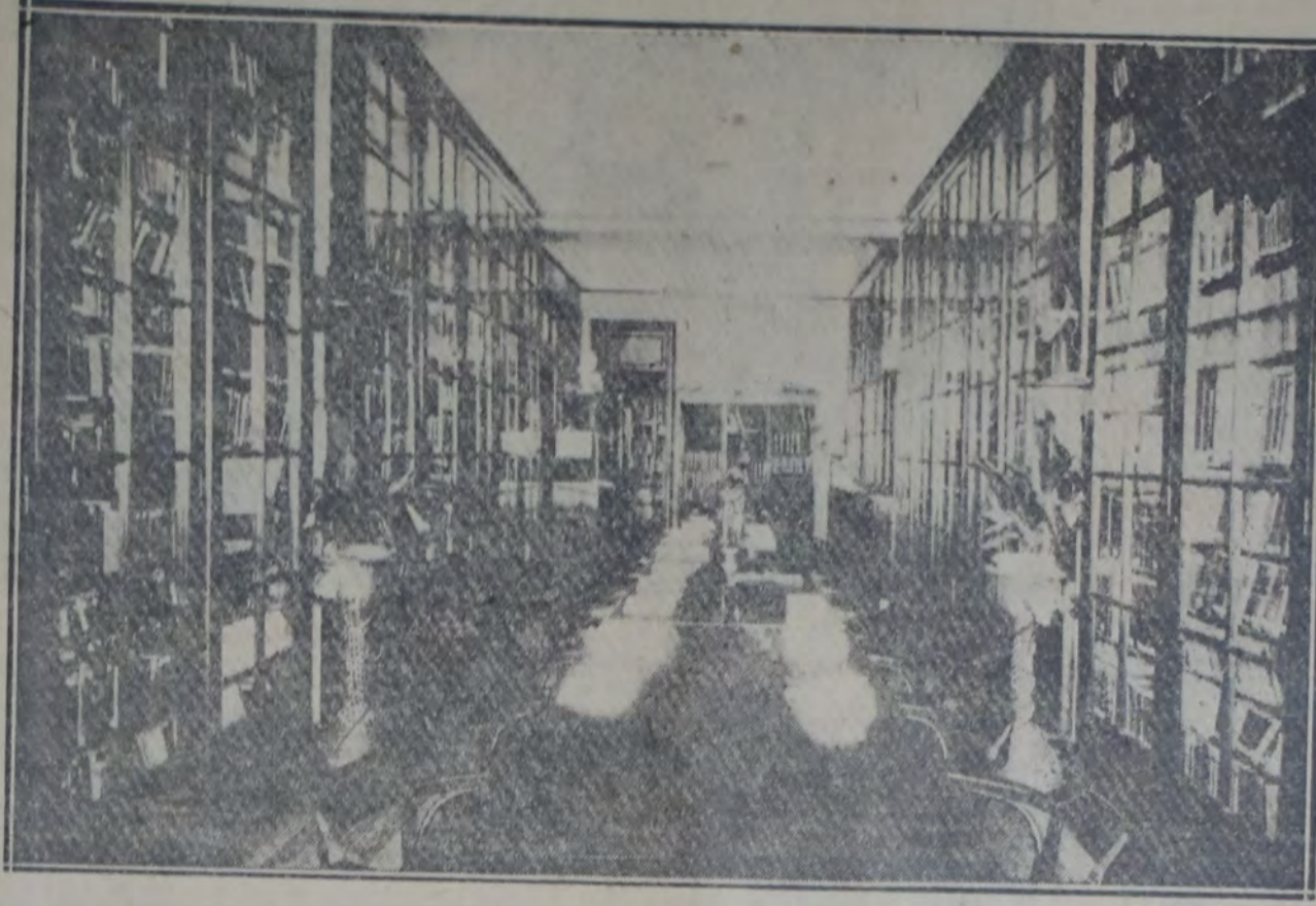
SALA DE LECTURA